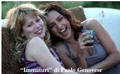
“Immaturo” di Paolo Genovese

Venerdì 12 Agosto : Piazza del Comune- film “Immaturo” di Paolo Genovese